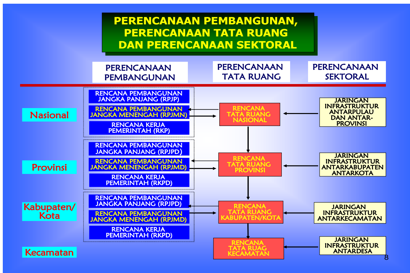
Diagram 1.2. Hubungan Perencanaan Pembangunan dengan Rencana Tata Ruang